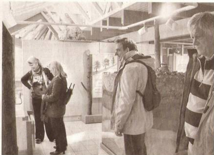
Die Lauftreffler informieren sich an zahlreichen Schautafeln im StadtWaldHaus über den Lebensraum Wald.